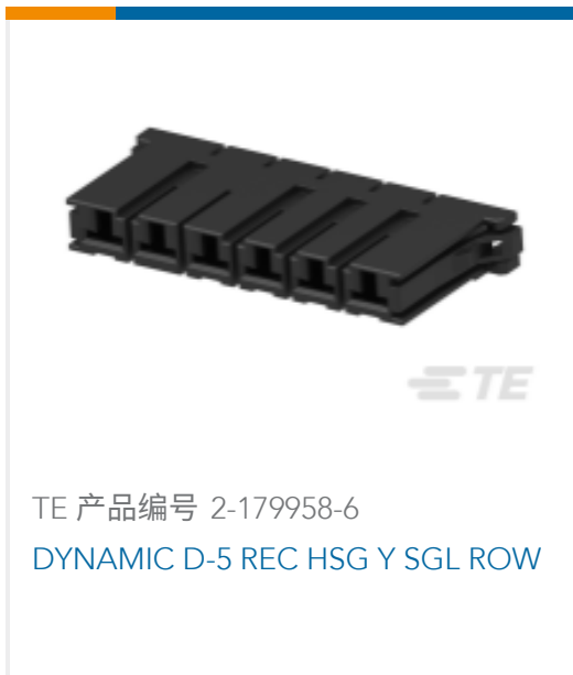
TE 产品编号 2-179958-6 DYNAMIC D-5 REC HSG Y SGL ROW