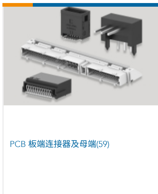
PCB 板端连接器及母端(59)