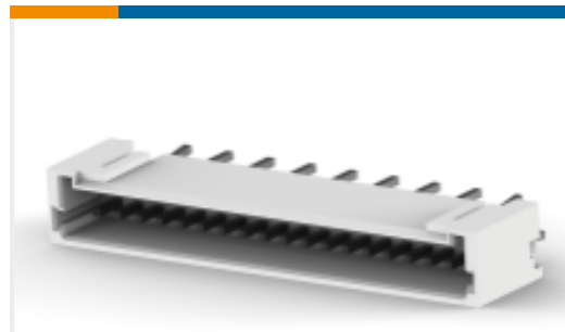
TE 产品编号3-292207-9 MINI CT SGL DIP V 19P BLACK