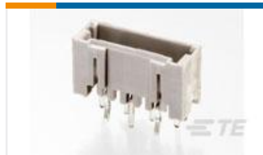
TE 产品编号1-292207-0 MINI CT SGL DIP V 10P NAT