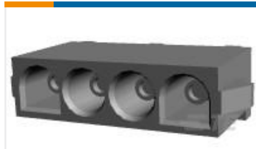
TE 产品编号350826-4 04P UMNL HDR ASSY PC 94VO LF