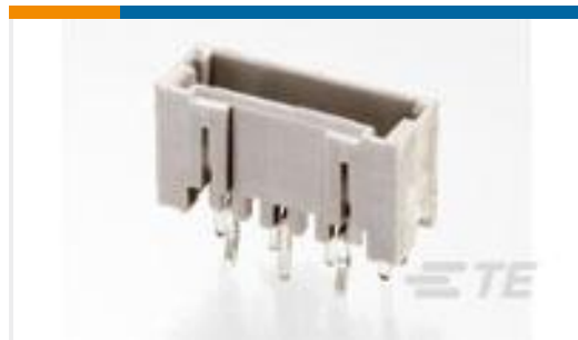
TE 产品编号1-292207-6 MINI CT SGL DIP V 16P NAT