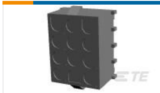
TE 产品编号350829-4 12P UMNL HDR ASSY PC 94VO LF