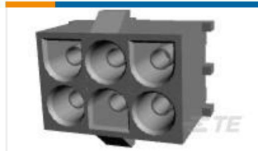
TE 产品编号350827-4 06P UMNL HDR ASSY PC 94VO LF