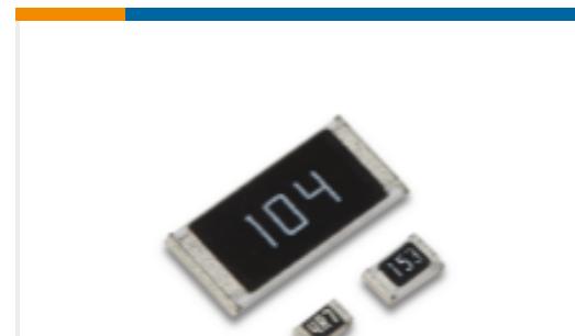
TE 产品编号2176347-6 CRGCQ 2010 27R 1%