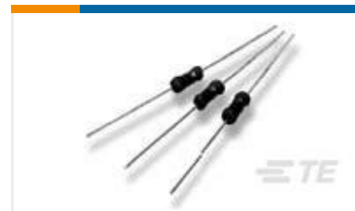
TE 产品编号9-1879352-1 RR02 5% 1K8 AMMO