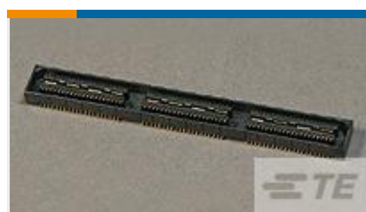
TE 产品编号2-1658012-3 MSB0.80RC-ASY120FL-,10,-TY