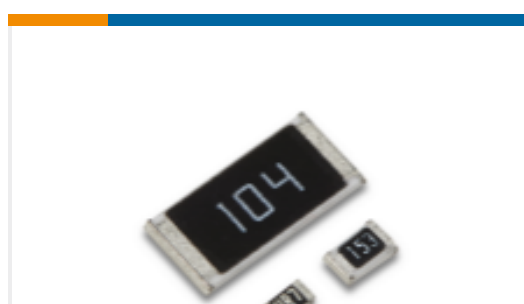
TE 产品编号2176347-6 CRGCQ 2010 27R 1%