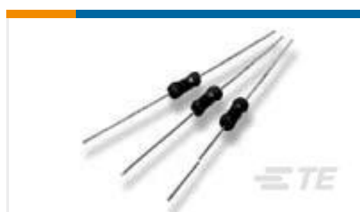
TE 产品编号9-1879352-1 RR02 5% 1K8 AMMO