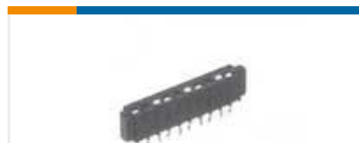
TE 产品编号5-520315-3 TRIOMATE ASSY V 3P L=3.556LDFR