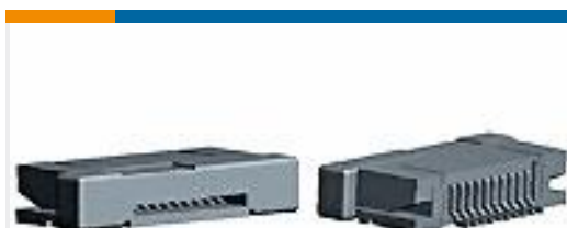
TE 产品编号2-1734592-9 FPC CONN. 0.5MM PITCH B/C, 29P