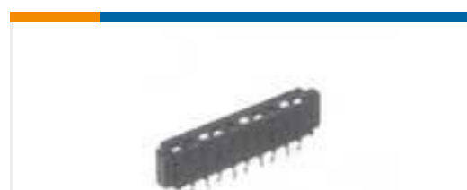
TE 产品编号5-520315-3 TRIOMATE ASSY V 3P L=3.556LDFR