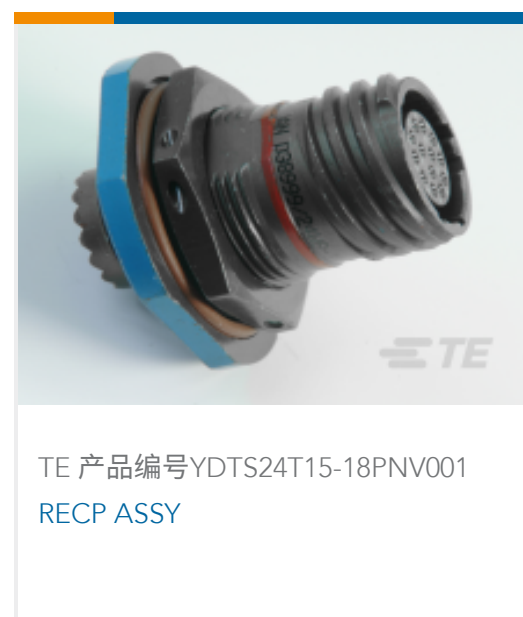
TE 产品编号YDTS24T15-18PNV001 RECP ASSY