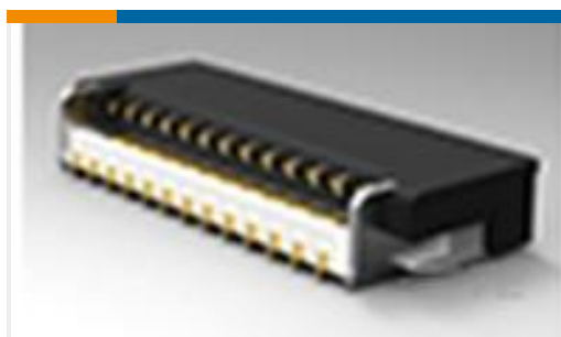
TE 产品编号2-2040832-1 EMBOSS TAPING 0.25FPC BF-L-1.3