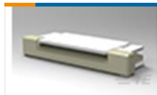
TE 产品编号2-1734839-3 FPC CONN. 0.5MM PITCH T/C,23P