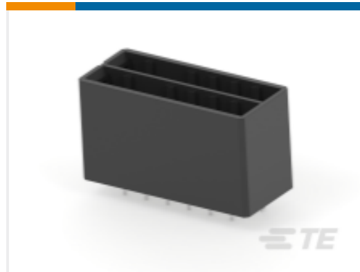
TE 产品编号1-316080-3 Dynamic 3200 HDR 组件