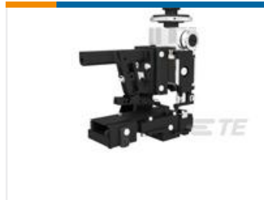
TE 产品编号2151018-1 OCEAN_2.0_APPLICATOR-S-090F110F