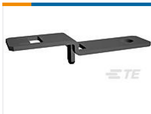
TE 产品编号5900121-2 DYNAMIC D-3 FREE HANGING HOOK