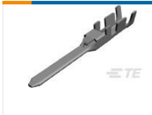
TE 产品编号917512-3 DYNAMIC D-3 TAB CONT. 2L AU 0.76 L/P