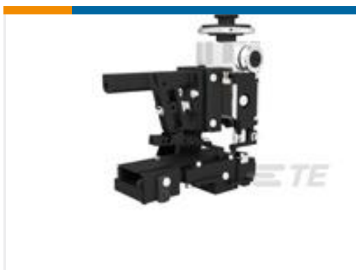
TE 产品编号2151073-1 OCEAN_2.0_APPLICATOR-S-100F110O