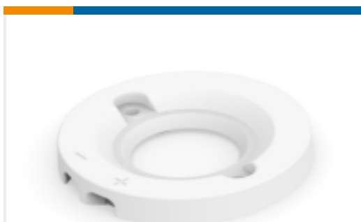
TE 产品编号2213407-2 LUMAWISE LED HOLDER Z50 STD PROFILE 2424