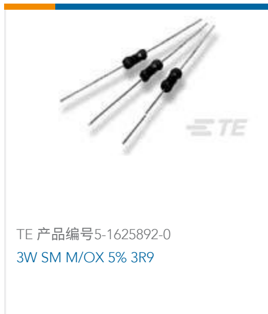
TE 产品编号5-1625892-0 3W SM M/OX 5% 3R9