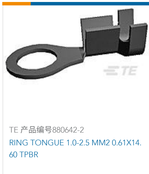
TE 产品编号880642-2 RING TONGUE 1.0-2.5 MM2 0.61X14.60 TPBR