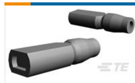
TE 产品编号170823-2 250 FASTON SLEEVE,REC., TRANSPARENT