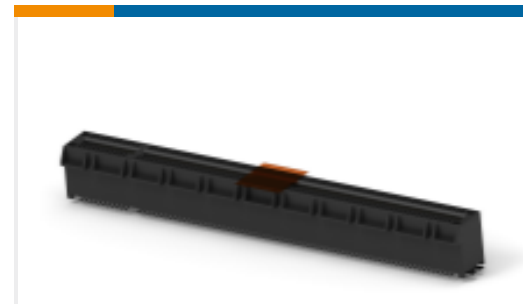
TE 产品编号 5-2337939-4 PCIE GEN4 CON,SMT,164POS,30u", MYLAR,HT