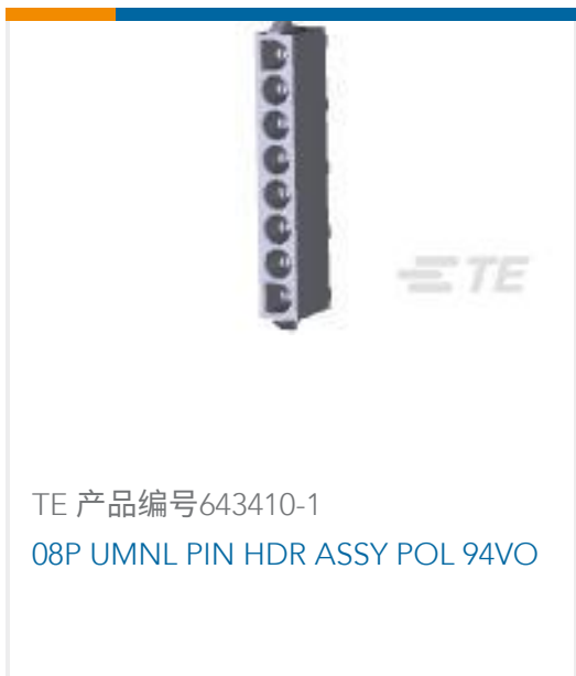
TE 产品编号643410-1 08P UMNL PIN HDR ASSY POL 94VO