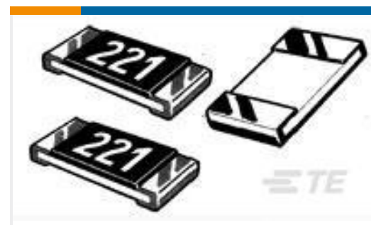
TE 产品编号2176070-7 3521 18R 1% 2W