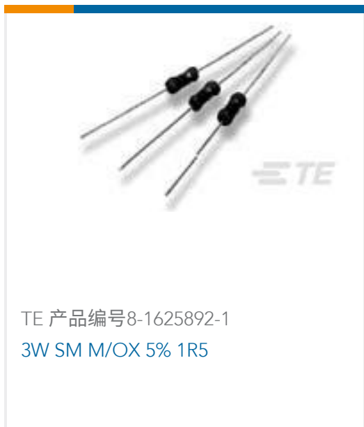
TE 产品编号8-1625892-1 3W SM M/OX 5% 1R5