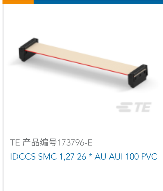
TE 产品编号173796-E IDCCS SMC 1,27 26 * AU AUI 100 PVC