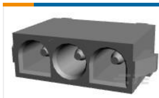
TE 产品编号350789-1 03P UMNL PIN HDR ASSY 94VO