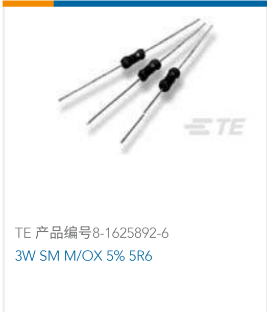
TE 产品编号8-1625892-6 3W SM M/OX 5% 5R6