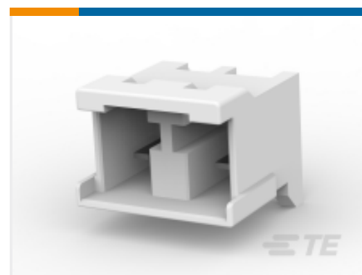
TE 产品编号 2-1747052-1 GIC7.92 2POS_HDR ASS'Y NAT KEYING C