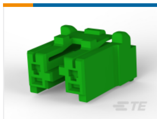
TE 产品编号 1-1747050-5 GIC 7.92 2POS PLUG GREEN KEYING B