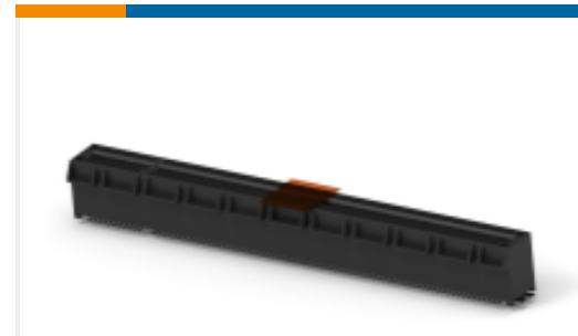
TE 产品编号 5-2337939-4 PCIE GEN4 CON,SMT,164POS,30u", MYLAR,HT