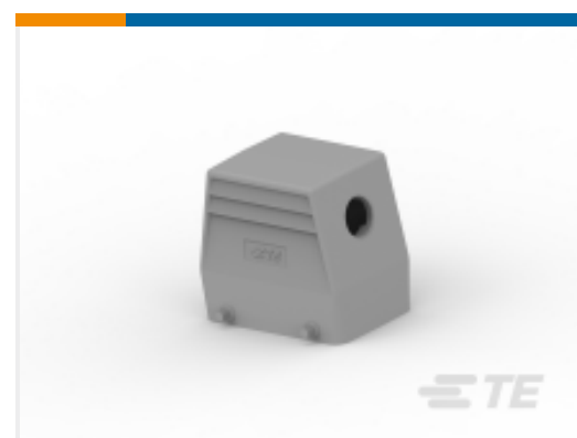
TE 产品编号T1319320120-000 H32A-TS-M20