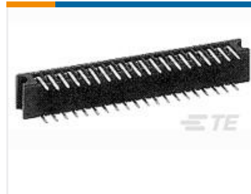
TE 产品编号7-532956-0 130 MODII 2PC CE RCPT ASSY, RoHS