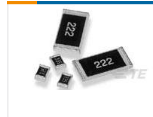
TE 产品编号3-2176067-2 CRG0201 1% 44R2