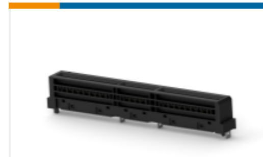
TE 产品编号2327677-3 RECEPT ASSY, 140 POS, VERT, SLIVER 2.0