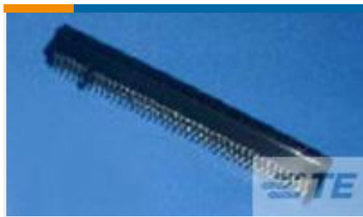
TE 产品编号 1734774-1 PCI EXP 3.1L 36 POS WHT G/F