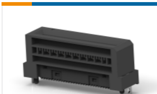
TE 产品编号2327679-3 RECEPTACLE ASSY, 56 POS, VERT, GEN Z