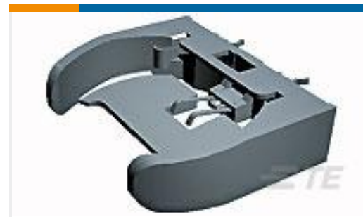
TE 产品编号2-1775485-1 Battery Holder, 3.6mm, BLK,low profile