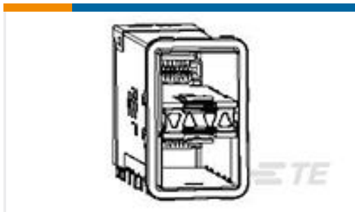
TE 产品编号2198318-2 zSFP+ STACKED 2X1 RECEPTACLE ASSEMBLY