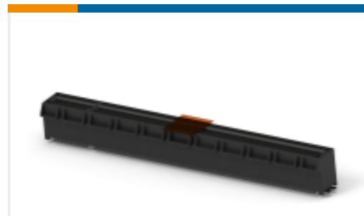
TE 产品编号 5-2337939-4 PCIE GEN4 CON,SMT,164POS,30u", MYLAR,HT