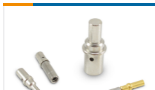
TE 产品编号0460-202-16141 DEUTSCH Solid Contacts