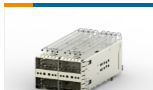
TE 产品编号2308171-1 ZQSFP+ CAGE& CONN 2X2, EMI SPRING, BTB