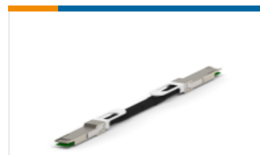
TE 产品编号2323767-3 DD-DD, 28AWG 2-8PR, 2.0M