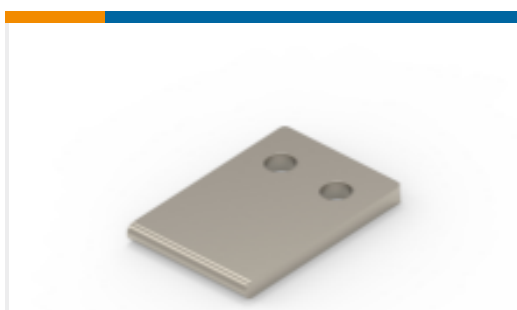
TE 产品编号2204929-3 MATING BLADE, CROWN CLIP SOCKET