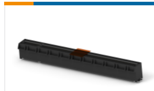
TE 产品编号 5-2337939-4 PCIE GEN4 CON,SMT,164POS,30u", MYLAR,HT