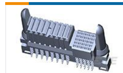
TE 产品编号2-1926739-5 AssyMinipak HdI25s10pRARectpSc