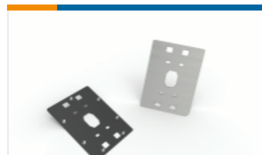
TE 产品编号2299805-1 NRW BACK PLATE ASSY, SOCKET P0, STUD6.8MM