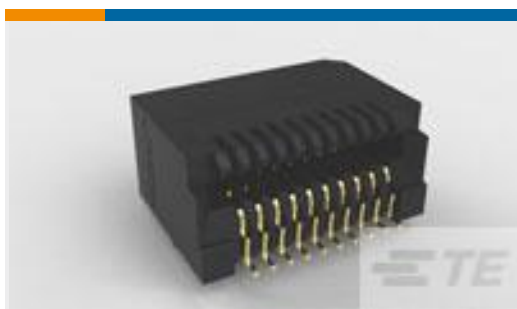
TE 产品编号1888247-1 20 POS SMT CONN, SFP/SFP+, 30A