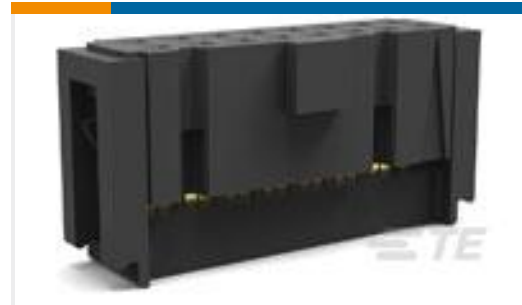
TE 产品编号2-1658527-3 622-2030LF=FSKT IDC S 20 30AU