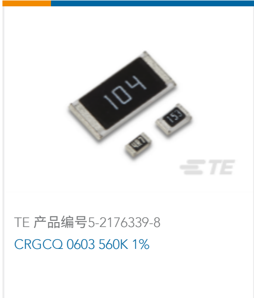
TE 产品编号5-2176339-8 CRGCQ 0603 560K 1%