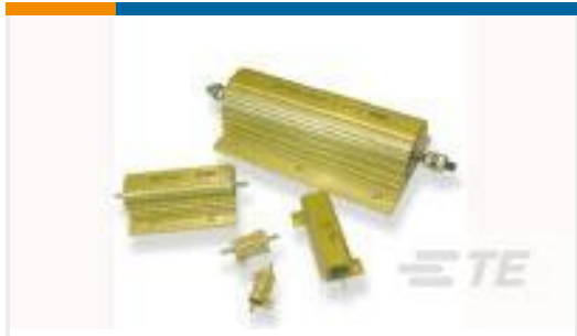
TE 产品编号8-1625999-7 HSC100 R044 5%