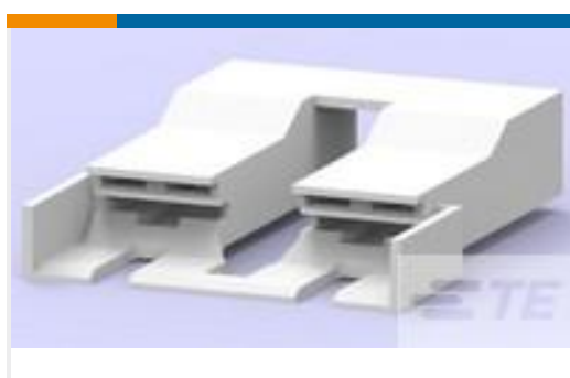
TE 产品编号1-521253-3 PL MKIII & FASTON 250 HSG 2P NYLON GREEN