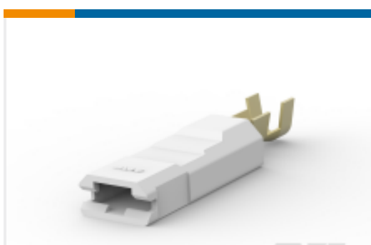
TE 产品编号1969104-1 ULTRA POD：直形，母端组件，无镀层，0.250 英寸