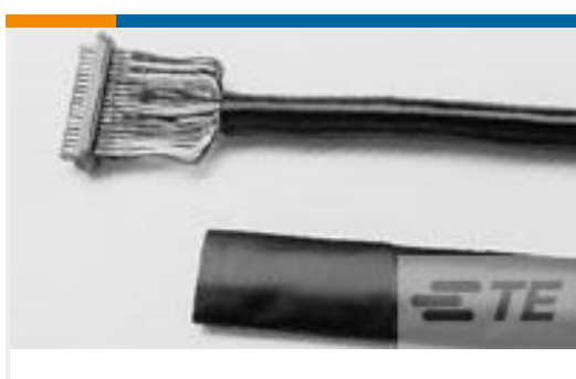
TE 产品编号530219P009 RNF-150-1/4-0-1.25IN