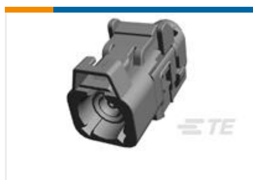
TE 产品编号1-2035141-0 PLUG KIT, 90 Deg, RG-316 or -174, Fakra