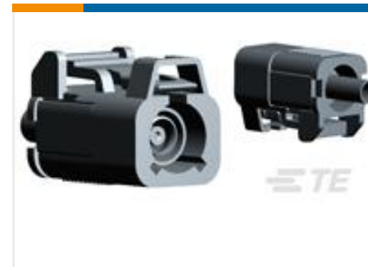
TE 产品编号1-1924792-0 PLUG KIT, UNASSEM, 1 POS, RG-316 OR RG-1