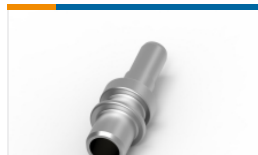
TE 产品编号1438889-1 JACK SUBASSEMBLY, RG-62, RG-62U /M, 18