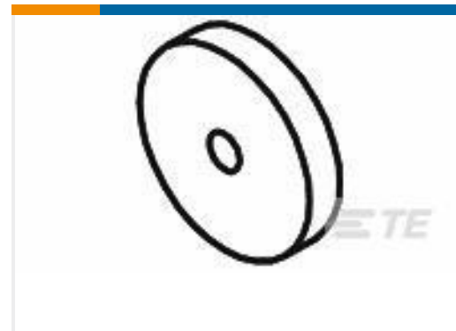
TE 产品编号1274233-1 SPACER, RG62U, MODIFIED