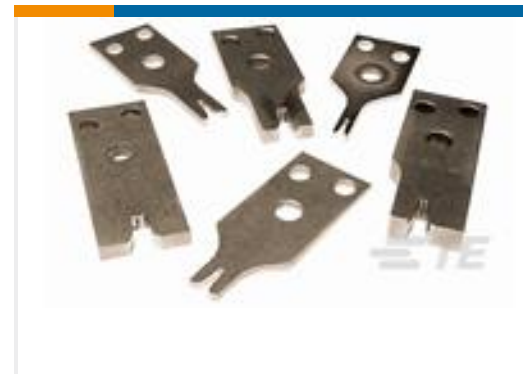
TE 产品编号4-1633588-7 CRIMPER, WIRE 'F' (.057)