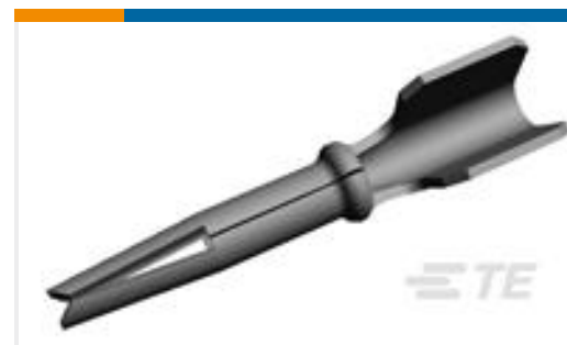
TE 产品编号1438896-4 SOCKET CONTACT, PLUG, 180 DEGREE, SMB