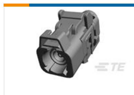
TE 产品编号2035141-3 PLUG KIT, 90 Deg, RG-316 or -174, Fakra