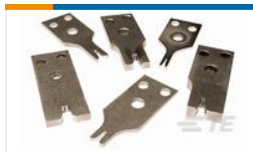
TE 产品编号1-1633730-7 CRIMPER, WIRE F .042 F