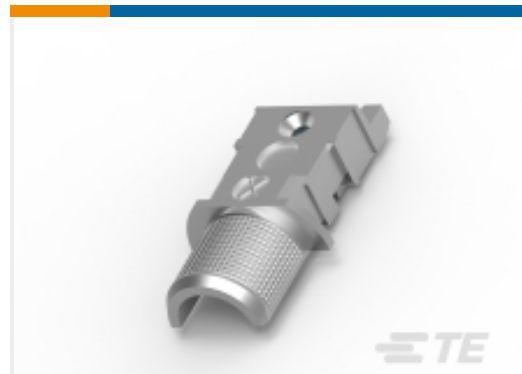
TE 产品编号1823954-1 FAKRA II, PLUG