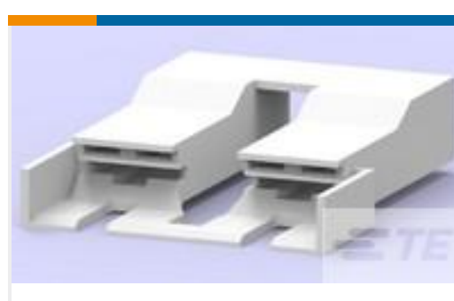
TE 产品编号1-521253-3 PL MKIII & FASTON 250 HSG 2P NYLON GREEN