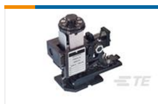
TE 产品编号1852646-1 EFHBPO200TABLOCK.210O LM/G