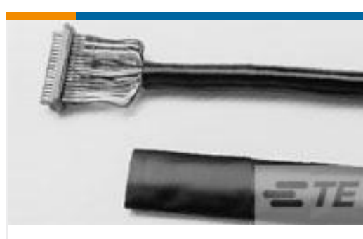
TE 产品编号530219P009 RNF-150-1/4-0-1.25IN