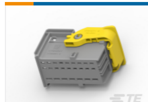
TE 产品编号1-1718485-5 AMP MCP Backshells