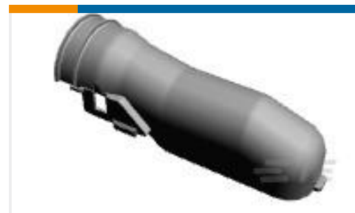
TE 产品编号1418882-1 COVER FOR 62POS.REC.HSG