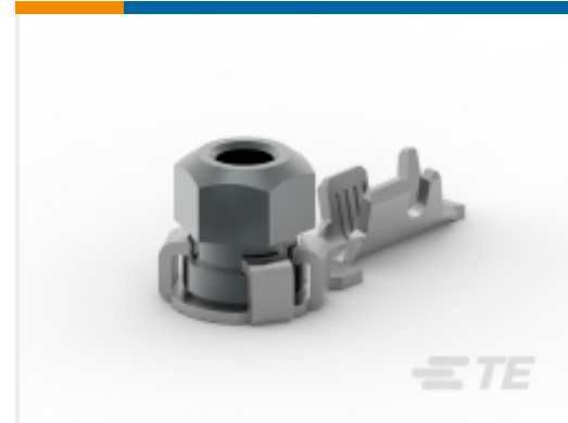
TE 产品编号2050842-1 Assy' Terminal Ring Tongue M4