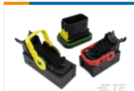
TE 产品编号3-1718324-1 LEAVYSEAL Housings