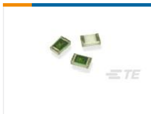
TE 产品编号4-2176091-1 RP 2A 0.25W 150R 0.1% 25PPM 1K RL