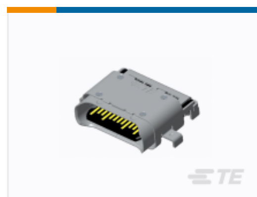
TE 产品编号1-2295018-2 USB TYPE C, REC OFFSET 0.65MM DUAL SMT