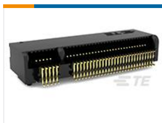
TE 产品编号2199230-4 M.2 0.5PITCH 4.2H KEY E 15U" AU