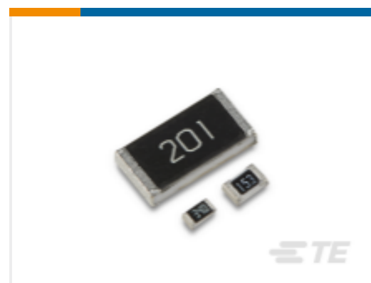
TE 产品编号4-2176325-9 CRGP 0402 100K 1%