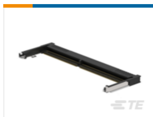
TE 产品编号2309411-1 DDR4 SO DIMM Sockets