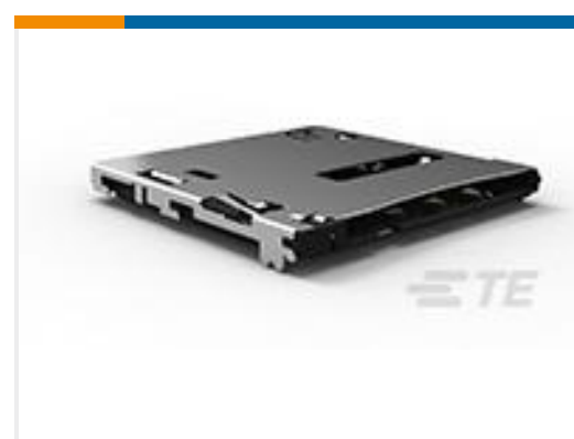
TE 产品编号2174803-2 PUSH-PUSH MICRO SIM CONNECTOR