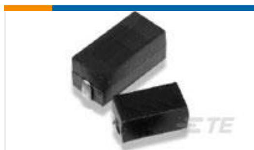
TE 产品编号3-1879021-5 SMW3 2R7 5%