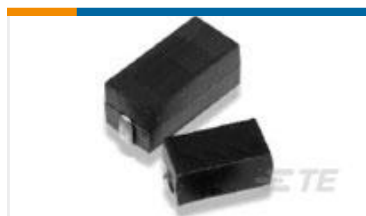
TE 产品编号1-1676966-9 SMW2 R56 5%