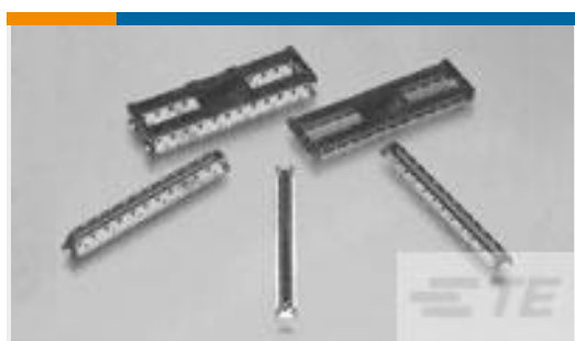
TE 产品编号3-6318491-6 .5FHP08H,220,S,GIG,08/Sn,HT,NSYes