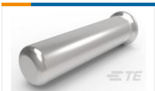
TE 产品编号50462-6 SOCKET,MIN-SPR AU SER-2