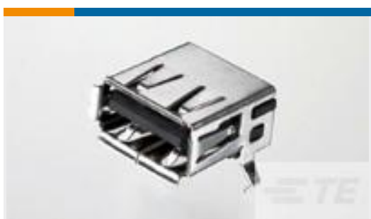
TE 产品编号292303-1 Std USB Type A, R/A, T/H