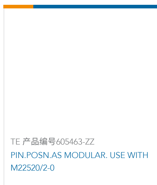
TE 产品编号605463-ZZ PIN.POSN.AS MODULAR. USE WITH M22520/2-0