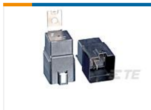
TE 产品编号6-1414989-1 V23134Z1020-EV-CBOX