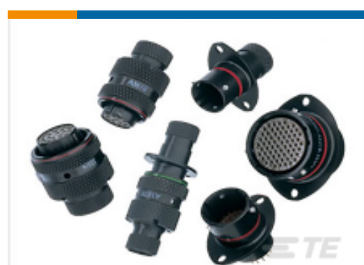
TE 产品编号AS218-32PN RECEPT.BOX MTG. TYPE 2