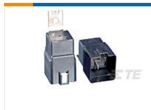
TE 产品编号1-1414122-0 V23136J1004X050-EV-CBOX