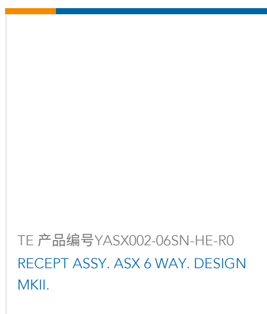
TE 产品编号YASX002-06SN-HE-R0 RECEPT ASSY. ASX 6 WAY. DESIGN MKII.