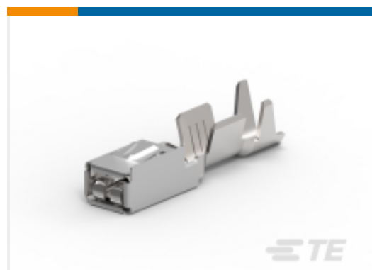
TE 产品编号968075-3 MPQ2,8 Ag rec LL unseal. >1-2,5