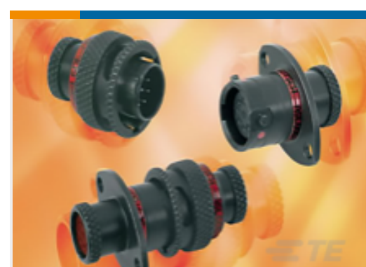
TE 产品编号ASDD010-23SN RECEPT 2 HOLE MTG ASSY 10-23 AS DOUBLE D