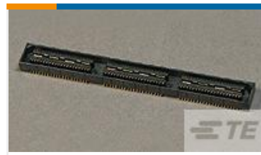
TE 产品编号 4-1658012-3 MSB0.80RC-ASY120FL,GP,10,-TR