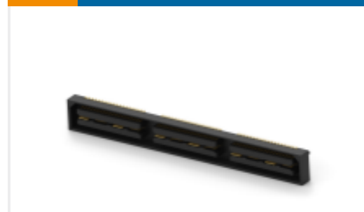
TE 产品编号 6-1658012-3 MSB0.80RC-ASY120FL,GP,10,-TR