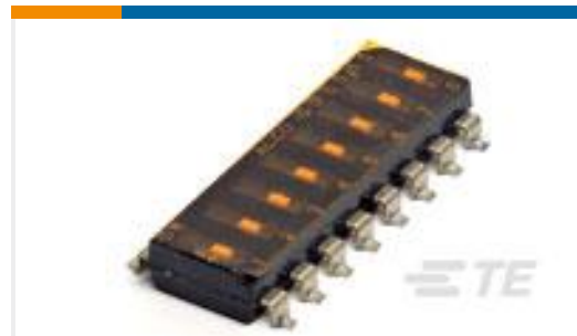
TE 产品编号1-1825006-9 GDS10S04=DIP SW,SLIDE,SMT