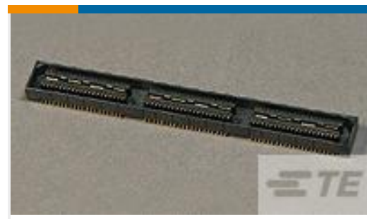
TE 产品编号 2-1658462-3 MSB0.80RC-ASY120FL,-,30,-TY