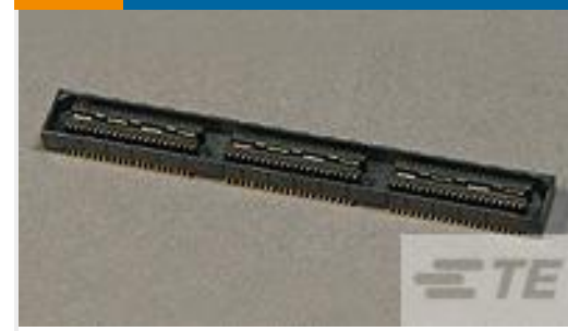
TE 产品编号 6-1658043-3 MSB0.80RC-ASY120FL,GP,F,-TR