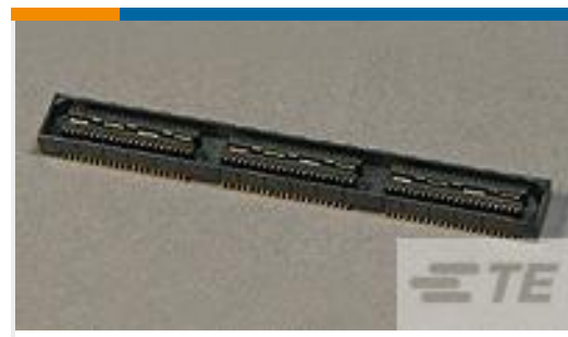
TE 产品编号 2-1658043-3 MSB0.80RC-ASY120FL,-,F,-TY