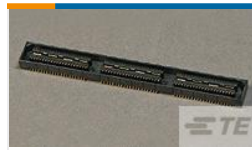
TE 产品编号 4-1658043-3 MSB0.80RC-ASY120FL,GP,F,-TR