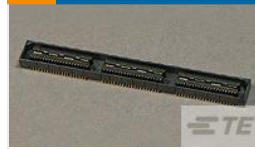
TE 产品编号 6-1658462-3 MSB0.80RC-ASY120FL,GP,30,-TR