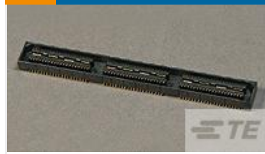
TE 产品编号 4-1658462-3 MSB0.80RC-ASY120FL,GP,30,-TR