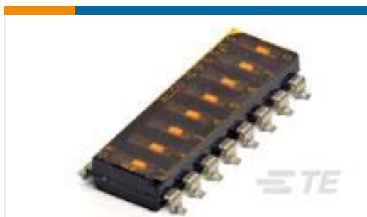
TE 产品编号1-1825006-9 GDS10S04=DIP SW,SLIDE,SMT