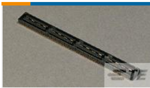
TE 产品编号 2-1658043-4 MSB0.80RC-ASY160FL,-,F,-TY