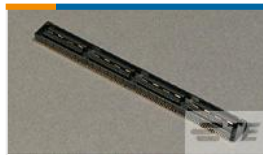
TE 产品编号 2-1658462-4 MSB0.80RC-ASY160FL,-,30,-TY