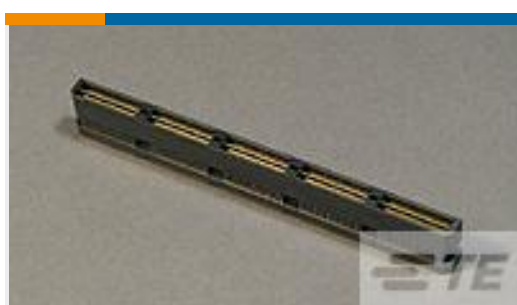
TE 产品编号 1658437-5 MSB0.80PL14ASY200FL,-,F,-TY