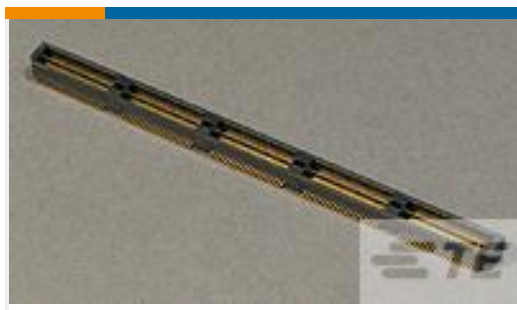
TE 产品编号 1658013-5 MSB0.80PL5ASY200FL,-,10,-TY