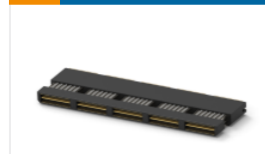
TE 产品编号 1658020-5 MSB0.80PL30ASY200FL,-,10,-TY