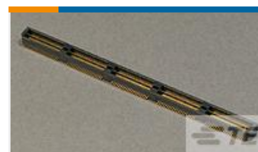
TE 产品编号 1658463-5 MSB0.80PL5ASY200FL,-,30,-TY