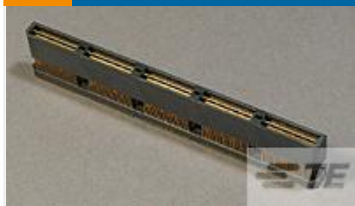
TE 产品编号 1658017-5 MSB0.80PL19ASY200FL,-,10,-TY