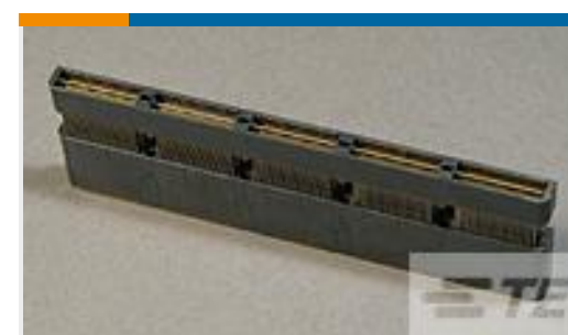
TE 产品编号 1658051-5 MSB0.80PL30ASY200FL,-,F,-TY