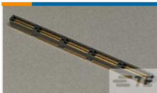
TE 产品编号 1658044-5 MSB0.80PL5ASY200FL,-,F,-TY