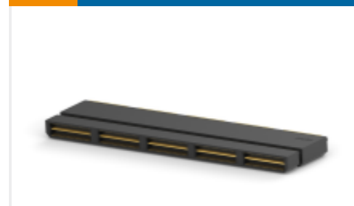
TE 产品编号 1658019-5 MSB0.80PL25ASY200FL,-,10,-TY