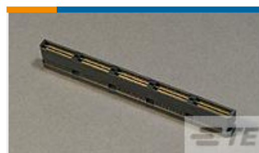
TE 产品编号 1658439-5 MSB0.80PL14ASY200FL,-,30,-TY