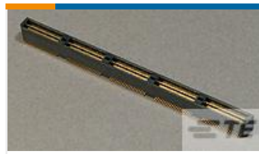
TE 产品编号 1658014-5 MSB0.80PL8ASY200FL,-,10,-TY