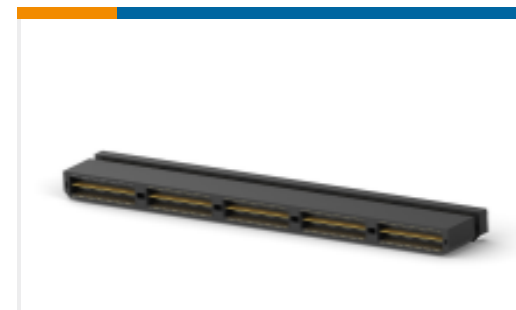
TE 产品编号 1658016-5 MSB0.80PL16ASY200FL,-,10,-TY