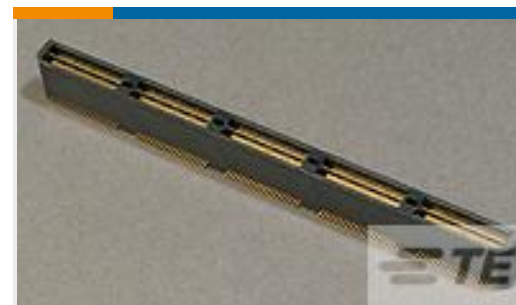
TE 产品编号 1658046-5 MSB0.80PL11ASY200FL,-,F,-TY