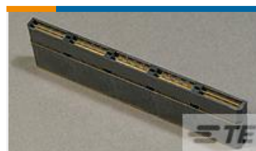
TE 产品编号 1658050-5 MSB0.80PL25ASY200FL,-,F,-TY