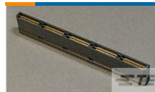
TE 产品编号 1658047-5 MSB0.80PL16ASY200FL,-,F,-TY