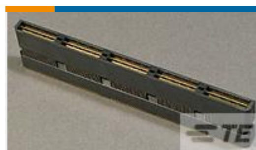
TE 产品编号 1658049-5 MSB0.80PL22ASY200FL,-,F,-TY