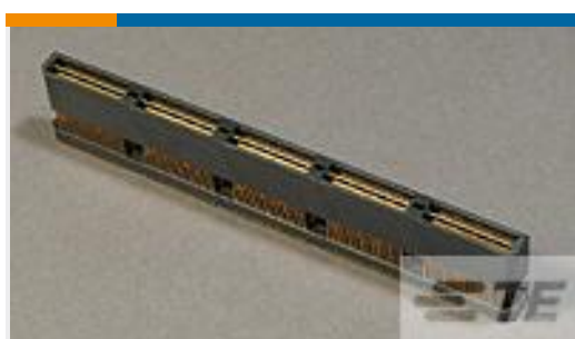
TE 产品编号 1658048-5 MSB0.80PL19ASY200FL,-,F,-TY