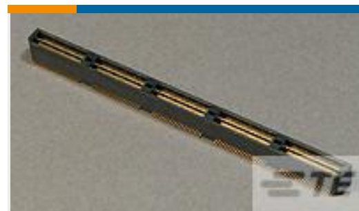
TE 产品编号 1658045-5 MSB0.80PL8ASY200FL,-,F,-TY