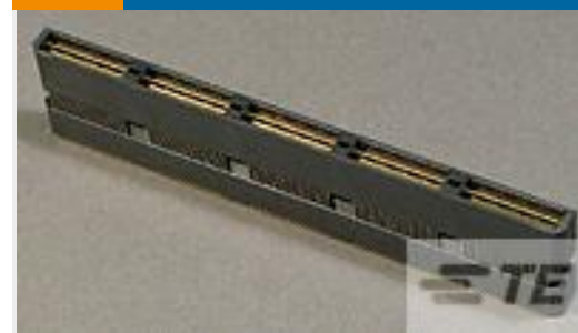
TE 产品编号 1658018-5 MSB0.80PL22ASY200FL,-,10,-TY