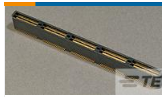
TE 产品编号 1658015-5 MSB0.80PL11ASY200FL,-,10,-TY