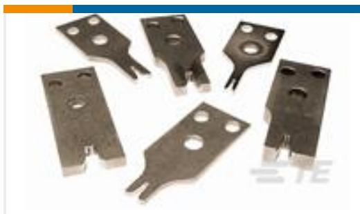
TE 产品编号1-1633712-7 CRIMPER, INSULATION "F".043