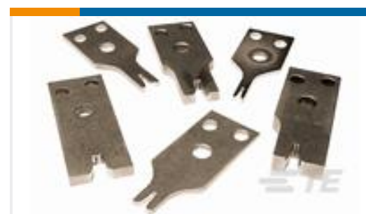
TE 产品编号1-562108-5 CRIMPER WIRE