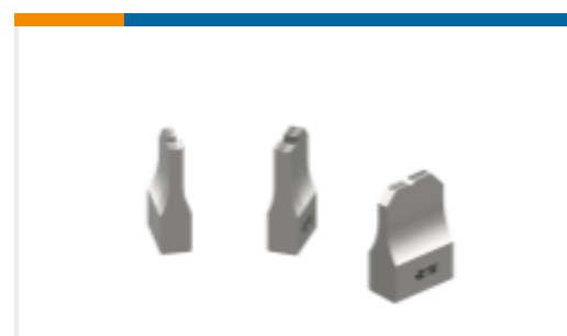
TE 产品编号1-1633620-2 ANVIL, COMBINATION