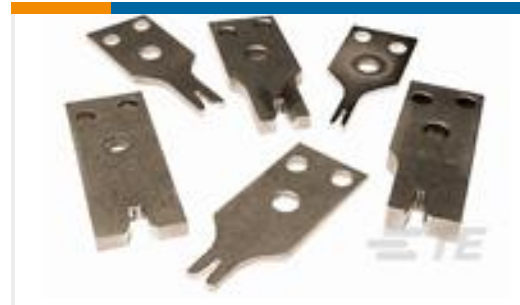
TE 产品编号6-456402-5 CRIMPER, WIRE .055 "F"