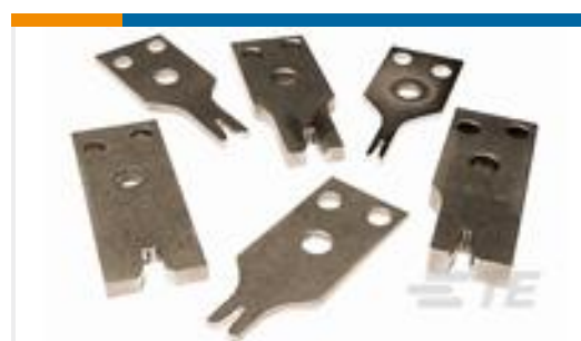
TE 产品编号3-456403-4 CRIMPER, WIRE (.062F X .100TH)