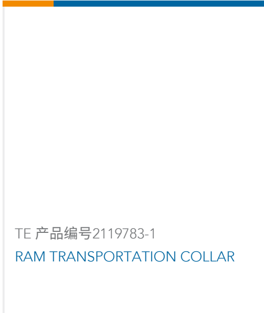
TE 产品编号2119783-1 RAM TRANSPORTATION COLLAR