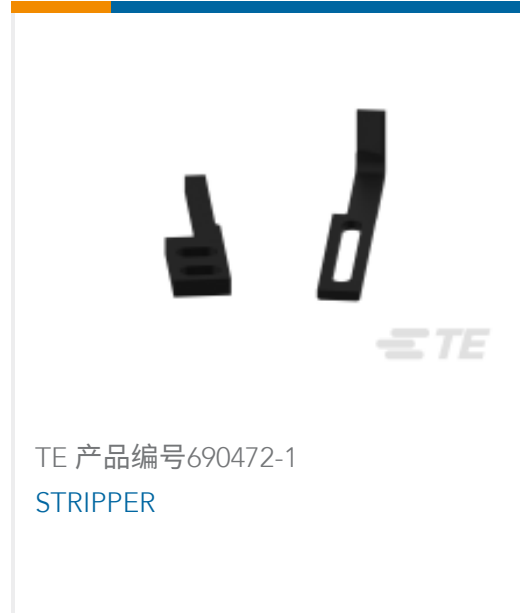
TE 产品编号690472-1 STRIPPER