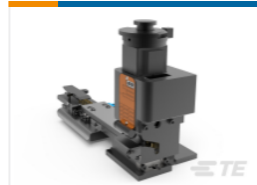
TE 产品编号1803583-9 APPLICATOR BASIC ASSEMBLY, SF