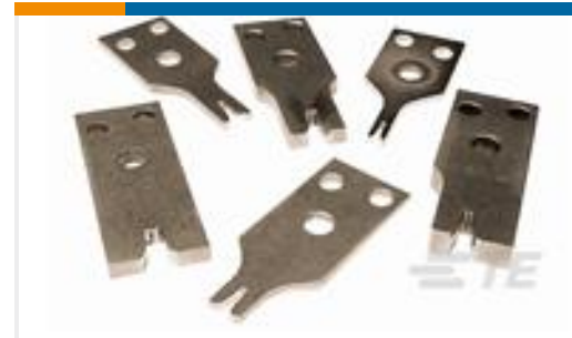
TE 产品编号7-683454-8 CRIMPER, INSULATION "O" (.080")