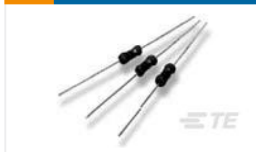
TE 产品编号1-1625893-3 5W SM M/OX 2% 22R