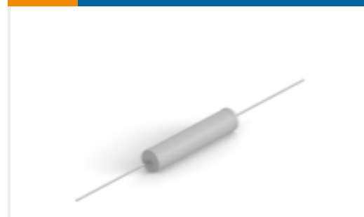
TE 产品编号9-2176415-0 8W STD M/OX 5% 150K