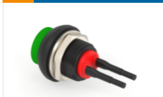
TE 产品编号2329359-9 PB ON/OFF HC GRE M1 TERM IP68 500MM LHS