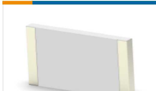
TE 产品编号2176246-8 CRGS2512 5% 3R9