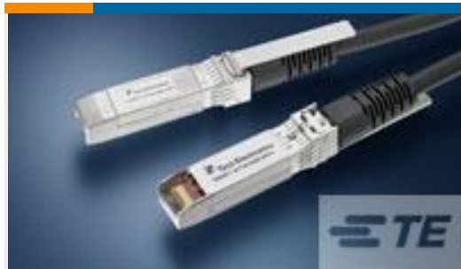
TE 产品编号2127931-1 C/A, SFP+, GENERIC, 0.5M