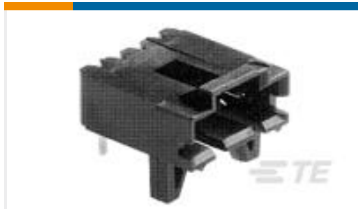
TE 产品编号5-103672-9 10 MTE HDR SRRA LATCH W/HLDWN