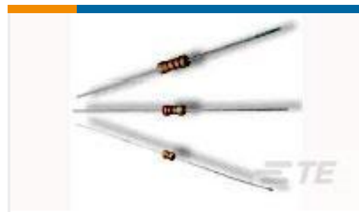
TE 产品编号 2-1623929-2 CFR200 5% 22K