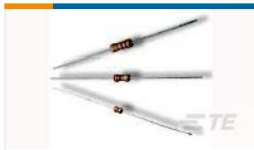
TE 产品编号 1623927-8 CFR16 5% 120R