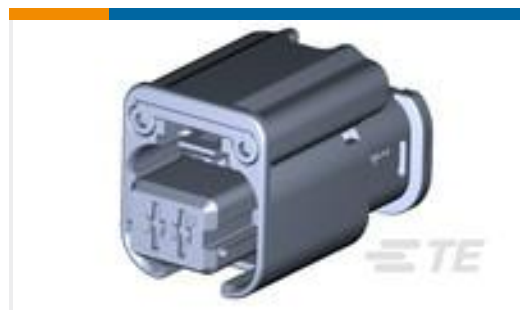
TE 产品编号 1801176-9 2W RECEPTACLE HPSSL CONNECTOR ORANGE