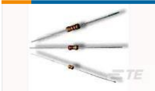
TE 产品编号 1623932-8 CFR50 5% 10K