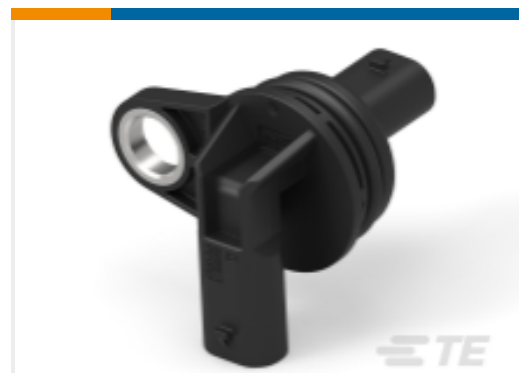
TE 产品编号 2236586-1 2POS, TAB1.2X0.6, HDR ASSY, 180DEG, MCON