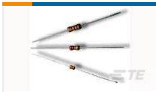
TE 产品编号 1623930-3 CFR25 5% 10K