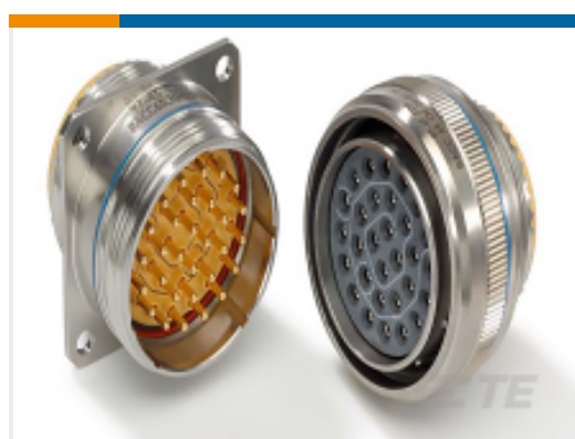
TE 产品编号 ZPF000000000007428 983-0S 20-41 P6 L