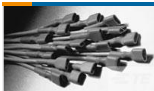
TE 产品编号 3809554001 LSTT-3.2-4-SP