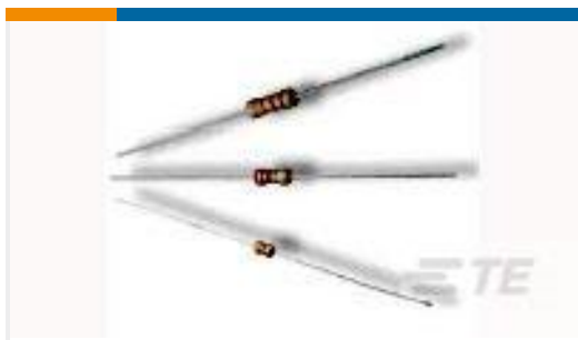
TE 产品编号 1623925-2 CFR100 5% 100R