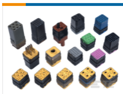
TE 产品编号 ZPF000000000114459 DMC-M 22-10 BA