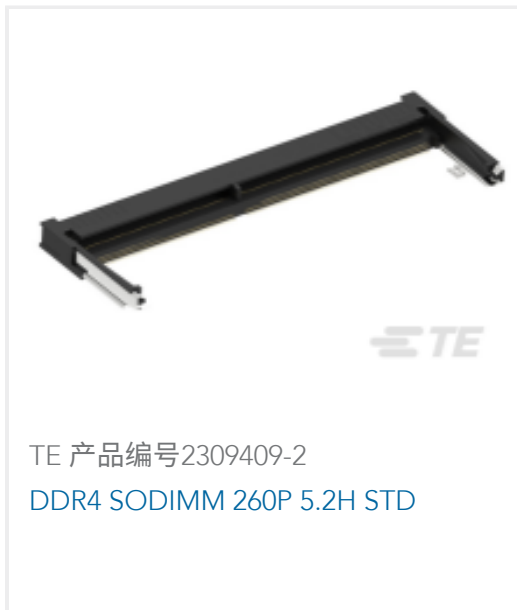
TE 产品编号2309409-2 DDR4 SODIMM 260P 5.2H STD