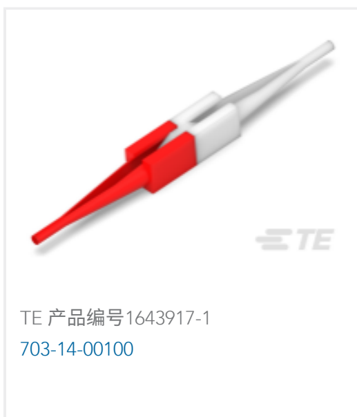
TE 产品编号1643917-1 703-14-00100