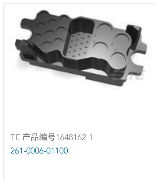
TE 产品编号1648162-1 261-0006-01100