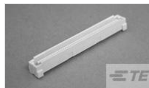
TE 产品编号5179029-3 0.8FH,P06H.5,080,08/Sn,TU