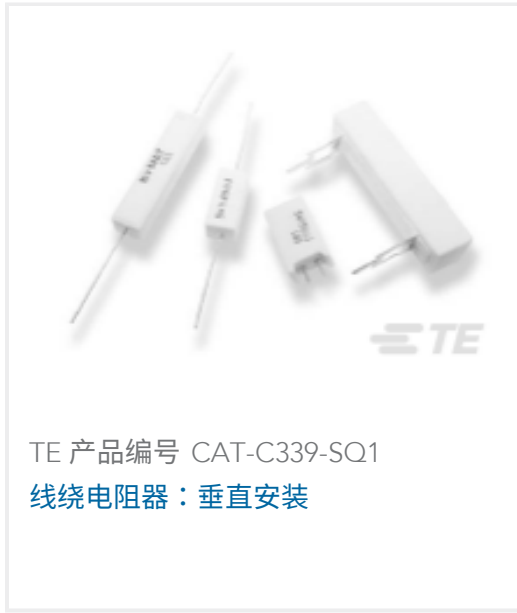
TE 产品编号 CAT-C339-SQ1 线绕电阻器：垂直安装