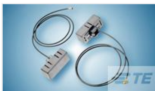
TE 产品编号1513472-5 UAM Assembly 360mm cable