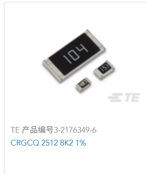
TE 产品编号3-2176349-6 CRGCQ 2512 8K2 1%