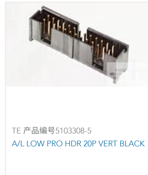
TE 产品编号5103308-5 A/L LOW PRO HDR 20P VERT BLACK