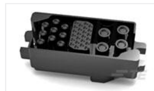
TE 产品编号6648167-1 CONN,SKT,75Amp MIDDLE DWR