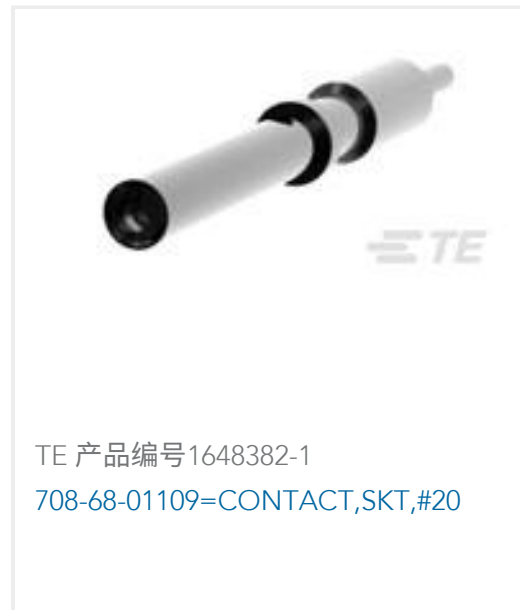
TE 产品编号1648382-1 708-68-01109=CONTACT,SKT,#20