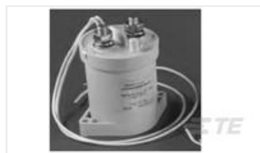
TE 产品编号2-1618393-6 LEV200H6ANA=RELAY,SPST-NO