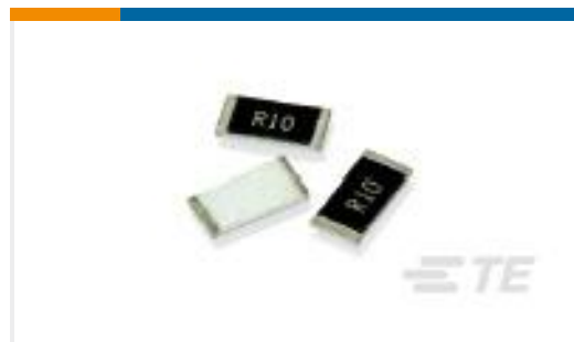
TE 产品编号2-1879461-5 RL73H 2A R13 1% 1K RL