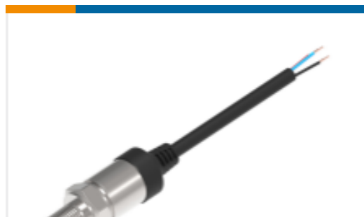
TE 产品编号20014203-12 PRESS XDCR M325M-000005-250PG