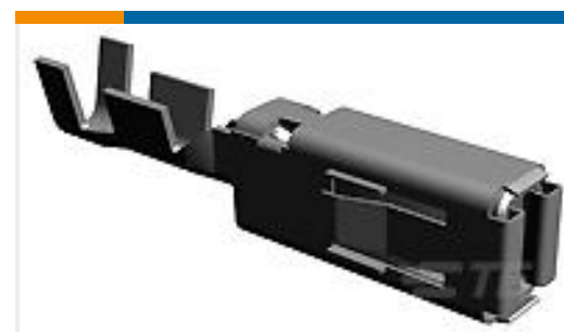
TE 产品编号1-968853-3 AMP MCP 2.8, CONTACT