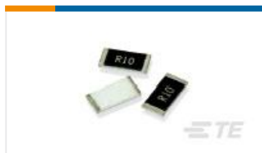
TE 产品编号2176055-1 RLP73V 2B R010 1% 1K RL