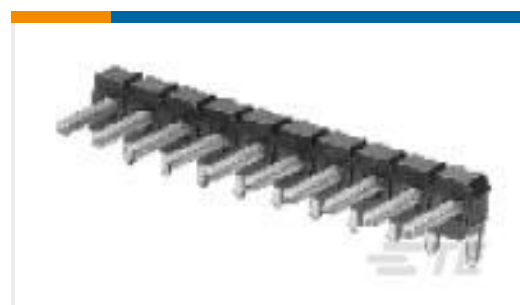
TE 产品编号826949-5 5P MOD2 STIFT LEI