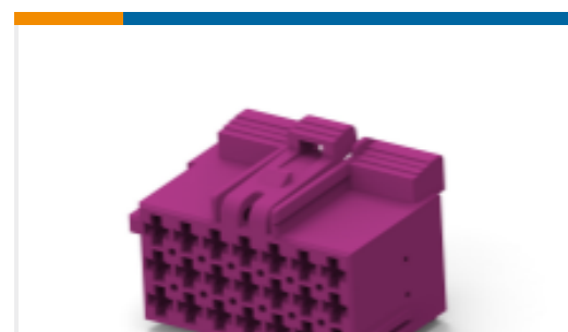
TE 产品编号1-967625-3 JUN-POW-TIM GEH 21P