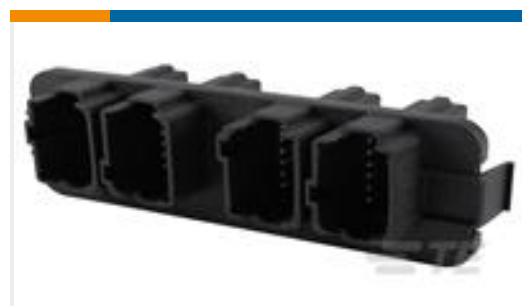
TE 产品编号DT13-48PABCD-R015 HDR, 48P, BLK, RA EEC, NI/CU, ABCD