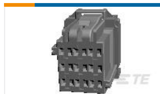
TE 产品编号8-968971-1 MCP2.8 GEH 9P