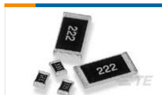
TE 产品编号9-1879510-1 CRGH0805 1% 10K 0.33W