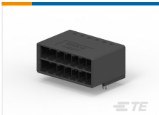
TE 产品编号1-2299005-1 DYNAMIC D3200M FMLB HDR ASSY 12P RR