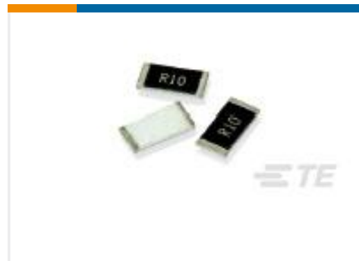
TE 产品编号3-1622824-8 RL73H 3A R30 1% 4K RL