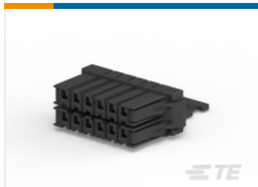
TE 产品编号1-2303378-1 D3200 FMLB REC STRAIN RELIEF KIT 12P RR