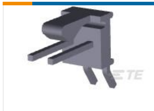
TE 产品编号644875-2 02P MTA100 HDR ASSY F/L,SP BND