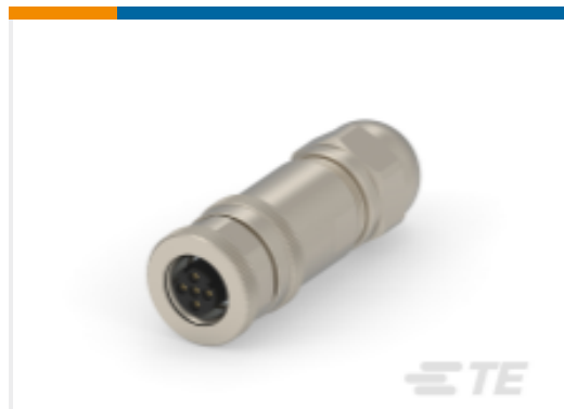
TE 产品编号T4110511051-000 M12 F, 5P GOLD D_CODE S SHIELDED PG7