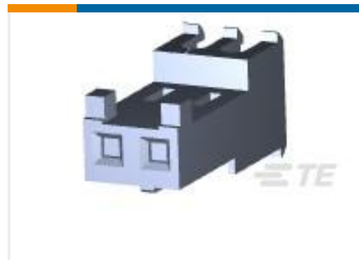
TE 产品编号3-644470-2 02P MTA156 CONN ASSY 20AWG LF