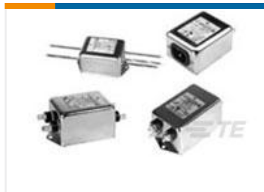
TE 产品编号6609032-7 3VR7=F7200 S0