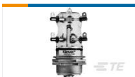
TE 产品编号1-1618273-5 H-16C=RELAY, VACUUM, DPDT