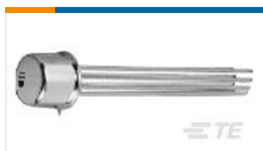
TE 产品编号3-1617118-0 J1MACDD-12XP = M39016/24-028P