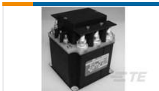
TE 产品编号1616021-6 SA136A=CONTACTOR 3PST N.O. 75