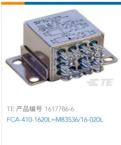
TE 产品编号 1617786-6 FCA-410-1620L=M83536/16-020L