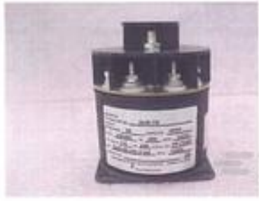
TE 产品编号1-1616037-6 DHR7B=CONTACTOR - 3PDT