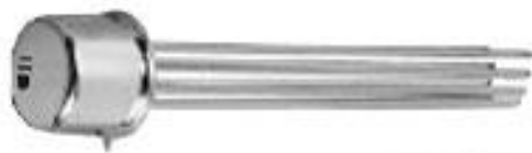
TE 产品编号3-1617118-0 J1MACDD-12XP = M39016/24-028P