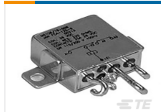
TE 产品编号4-1617791-5 FCA-125-3604L=M83536/36-004L