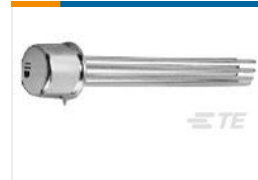
TE 产品编号1617120-5 J1MSW-26XP = M39016/10-023P