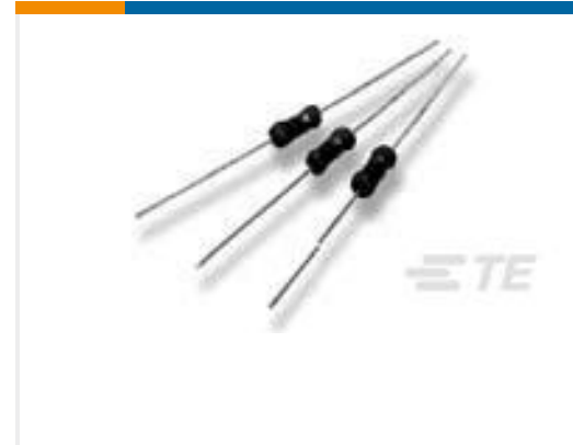
TE 产品编号8-1625890-5 2W SM M/OX 5% 200K