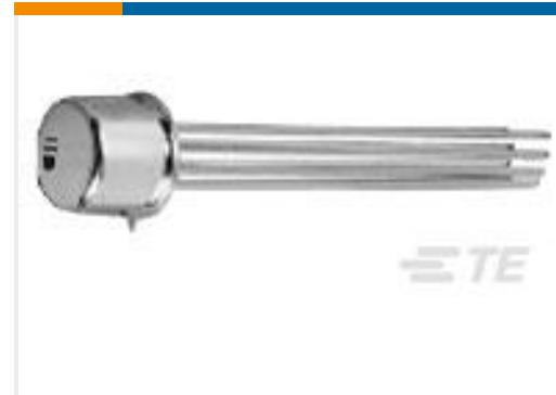
TE 产品编号3-1617119-2 J1MSCD-18XMS = M39016/25-048M