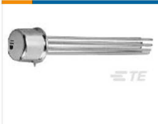
TE 产品编号1-1617122-9 JMACD-5XM = M39016/15-082M