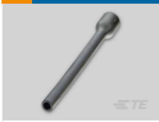
TE 产品编号707509-000 202F263-51-22/164-0