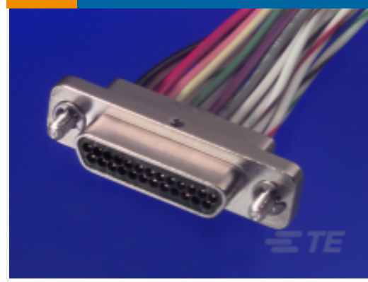
TE 产品编号2-1532179-4 M83513/03-A08C, MCKS-C2-B-9P5L5-1.0