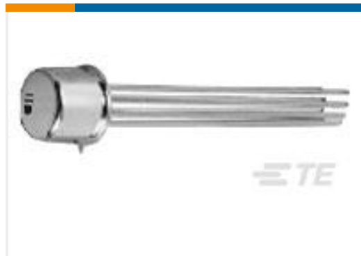
TE 产品编号5-1617568-5 JMAWD-6XP=M39016/15-029P