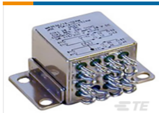
TE 产品编号5-1617808-6 TD228-1103P=TDFO 110 SEC M83726 /28-1103P