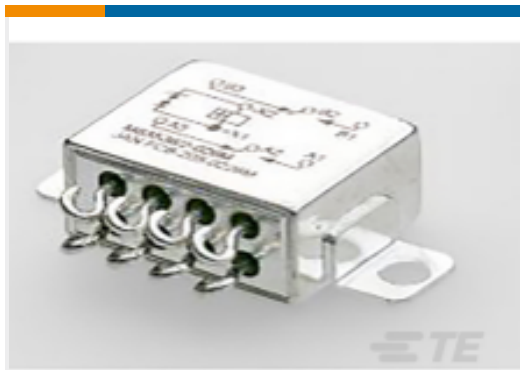
TE 产品编号9-1617784-2 FCB-205-0117M=M83536/1-017M