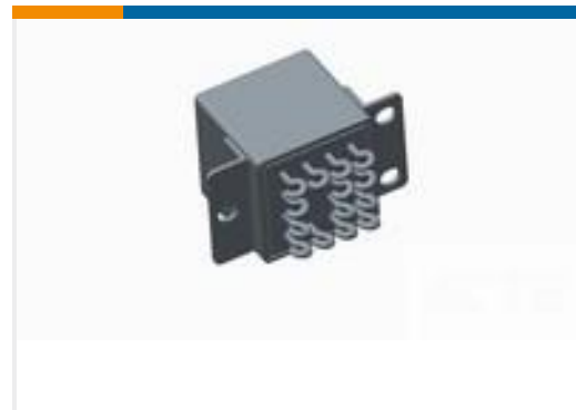
TE 产品编号2-1617807-4 TD228-2202S=TDFO 22 SEC M83726 /28-2202S