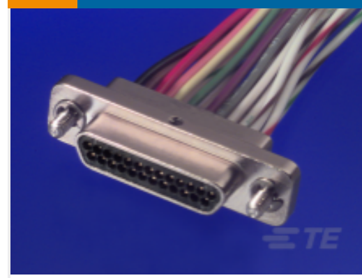
TE 产品编号2-1532186-9 M83513/03-H12C, MCKS-C2-B-100P6Q9-36.0