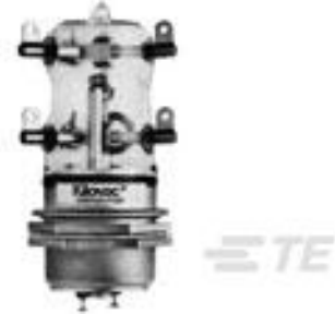
TE 产品编号1-1618273-5 H-16C=RELAY, VACUUM, DPDT