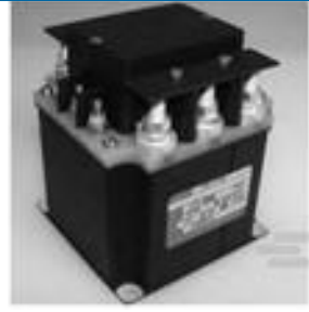
TE 产品编号1616021-6 SA136A=CONTACTOR 3PST N.O. 75