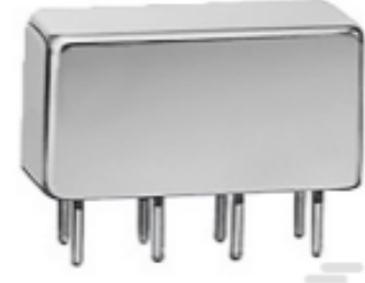
TE 产品编号3-1617536-2 HFW1230F01P=M39016/6-119P