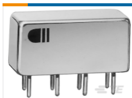
TE 产品编号 2-1617073-2 3SBC2020A2 = M39016/13-075P