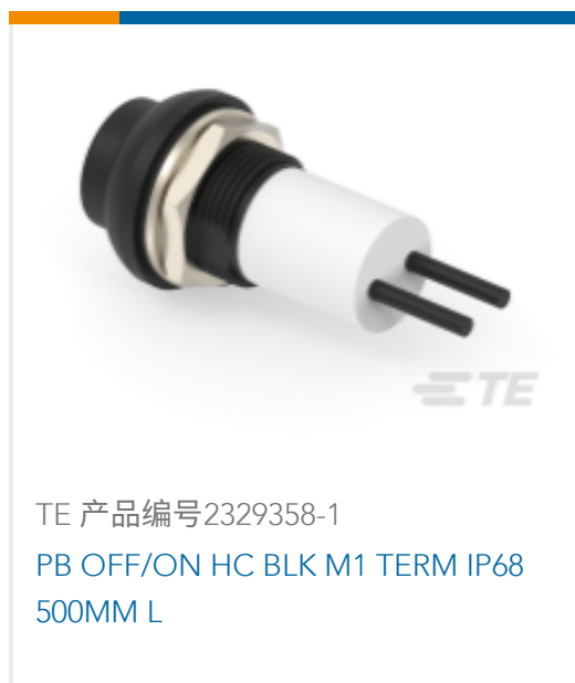
TE 产品编号2329358-1 PB OFF/ON HC BLK M1 TERM IP68 500MM L