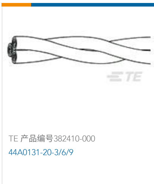
TE 产品编号382410-000 44A0131-20-3/6/9