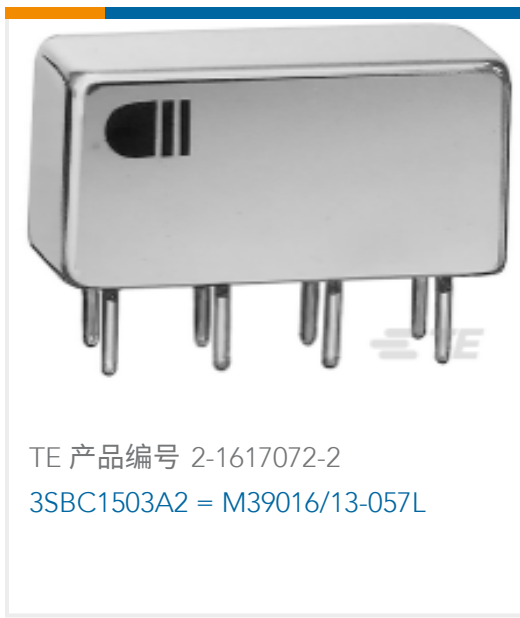
TE 产品编号 2-1617072-2 3SBC1503A2 = M39016/13-057L