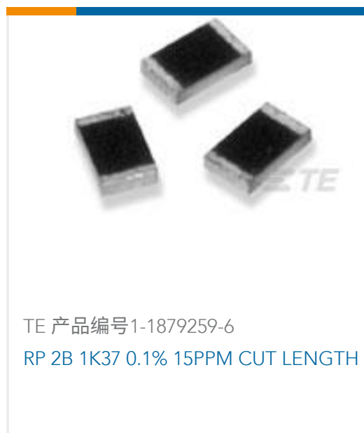
TE 产品编号1-1879259-6 RP 2B 1K37 0.1% 15PPM CUT LENGTH