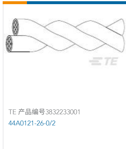
TE 产品编号3832233001 44A0121-26-0/2