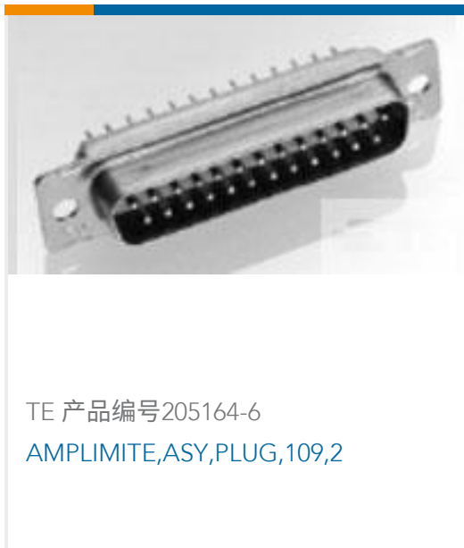
TE 产品编号205164-6 AMPLIMITE,ASY,PLUG,109,2