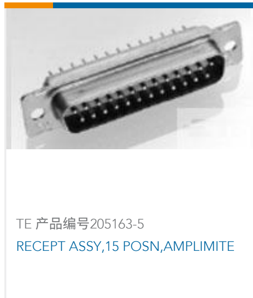
TE 产品编号205163-5 RECEPT ASSY,15 POSN,AMPLIMITE