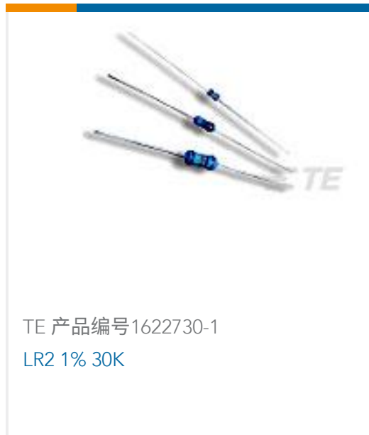
TE 产品编号1622730-1 LR2 1% 30K