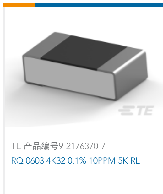
TE 产品编号9-2176370-7 RQ 0603 4K32 0.1% 10PPM 5K RL