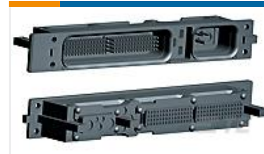
TE 产品编号448482-1 RECPT ASSY,SZ 1,ARINC