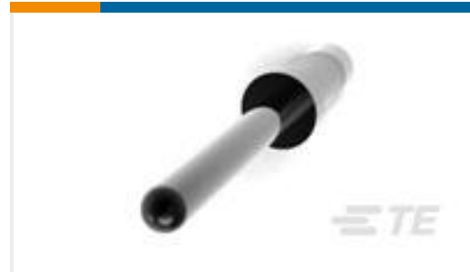
TE 产品编号1766194-1 CONTACT,PIN,#16