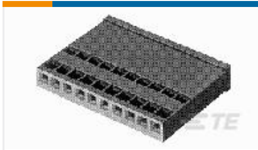
TE 产品编号87175-2 01 LOCKING CLIP HSG SR .100CL