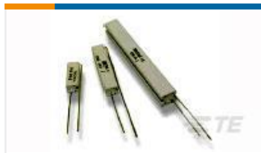
TE 产品编号4-1623732-6 BCHE 7 W 5R6 10%