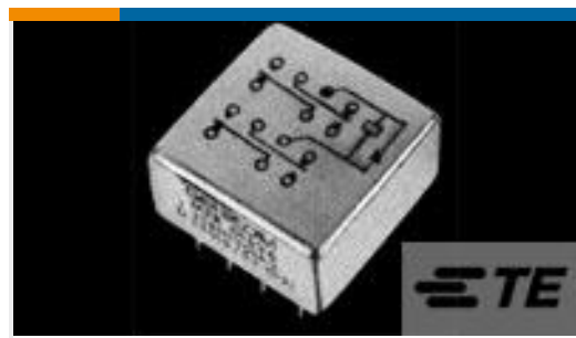
TE 产品编号3-1617076-0 3SBH1261A2 = M39016/54-011M