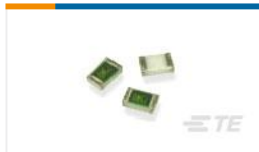
TE 产品编号6-1879133-0 RN 0603 3K65 0.1% 10PPM 1K RL