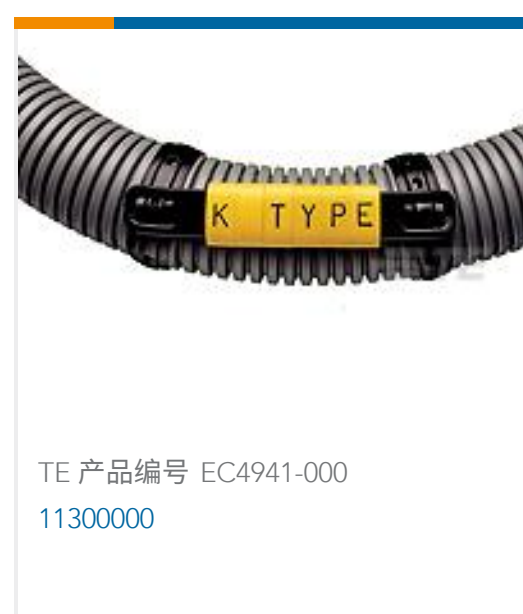
TE 产品编号 EC4941-000 11300000