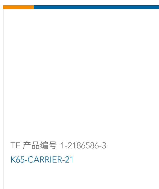
TE 产品编号 1-2186586-3 K65-CARRIER-21