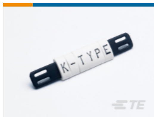
TE 产品编号 CAT-T3437-K1 K-Type Tie-On Markers