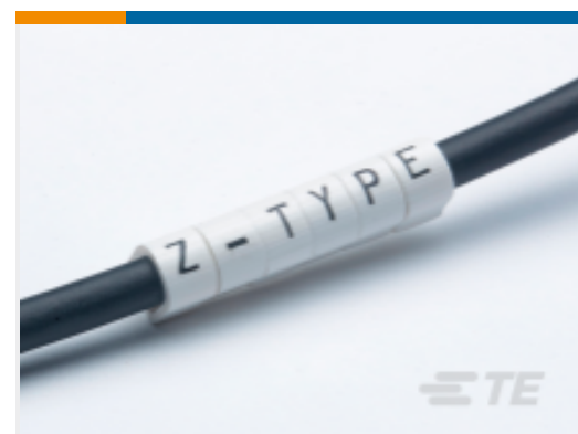
TE 产品编号 CAT-T3437-Z1 Z-Type Push-On Markers