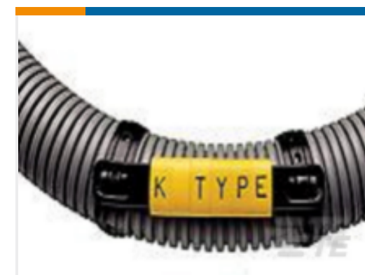
TE 产品编号 EC4943-000 11320000