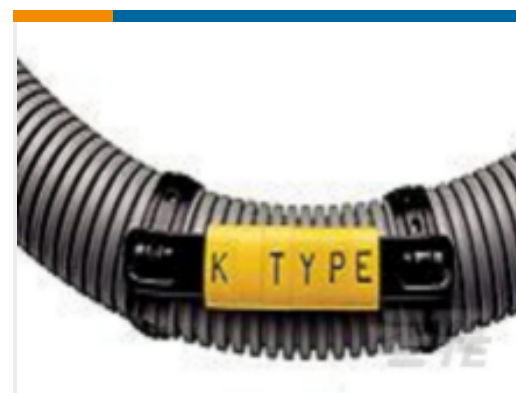
TE 产品编号 EC4942-000 11310000