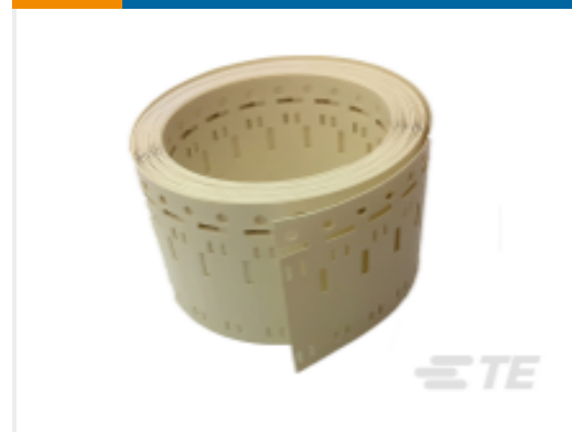
TE 产品编号 CAT-T3437-H85999 High Temperature Markers, HTCM-SCE-TP