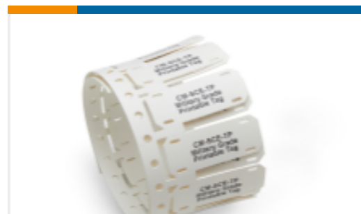
TE 产品编号 EL8598-000 CM-SCE-TP-1/2-6H-3