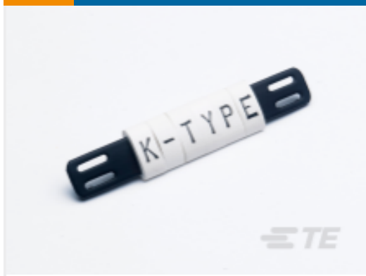
TE 产品编号 CAT-T3437-K1 K-Type Tie-On Markers