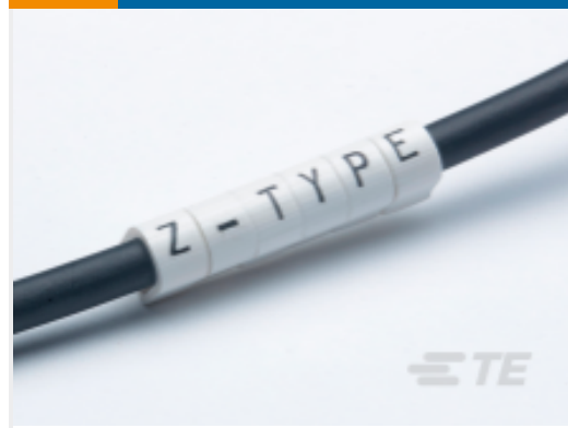
TE 产品编号 CAT-T3437-Z1 Z-Type Push-On Markers