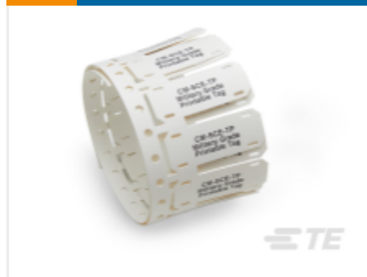
TE 产品编号 CAT-T3437-C6298 CM-SCE-TP Military Grade Markers