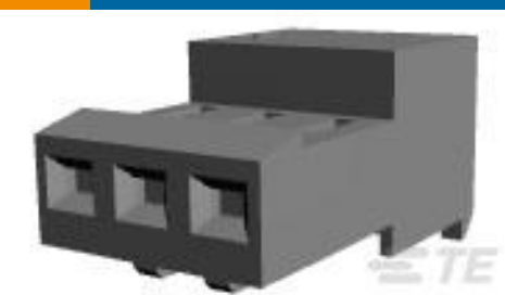
TE 产品编号3-640441-3 03P MTA100 CONN ASSY WHT